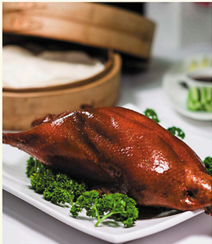
北京片皮鴨 每隻 Whole $600 Roasted Peking Duck 北京ダック