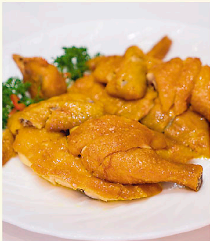
鹽焗脆皮雞 Baked Chicken in Rock Salt 鶏のロースト