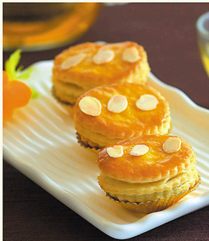
王子鮑魚酥 $38 Baked diced Abalone with Mushrooms Pastries アワビパイ