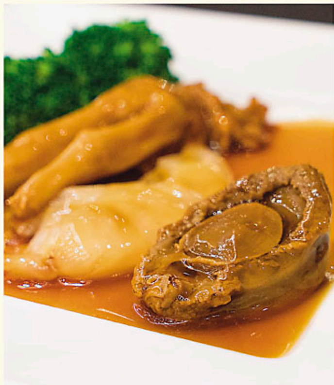
王子三寶 (23頭日本吉品鮑、天白菇、鵝掌) 每份 Per Piece $880 Braised 23 Head Yoshihama Abalone with Black Mushroom & Goose Web 23頭日本産吉浜アワビの蒸し煮