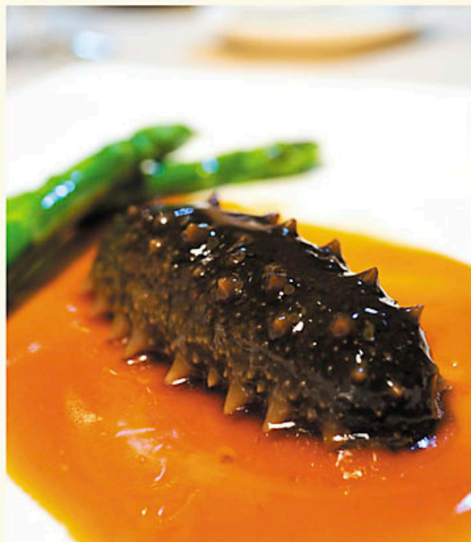
北海道刺參 每條 Per Piece $298 Hokkaido Sea Cucumber 北海道産海鼠