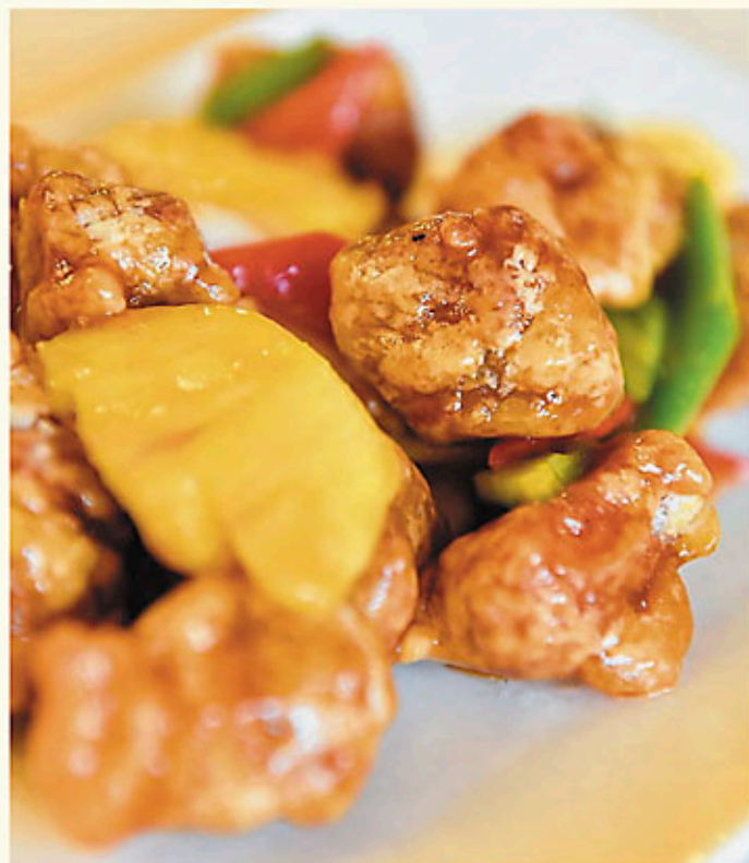
西班牙黑毛豬咕嚕肉 $168 Sweet & Sour Spanish Iberico Pork 酢イベリコ豚肉