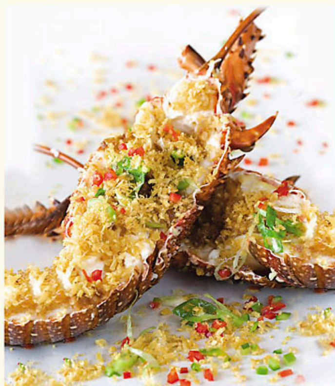
金銀蒜蒸開邊龍蝦 Seasonal Price 時價 Steamed Lobster with Crispy Garlic Sauce ロブスターの辛ガーリック蒸し