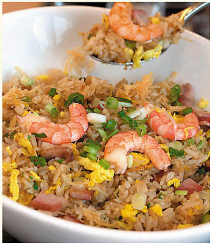
王子炒飯 $168 Prince's Fried Rice 王子チャーハン