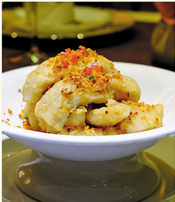
椒鹽九肚魚 $88 Deep-Fried Basa with Salt & Pepper 魚の塩胡椒のフライ