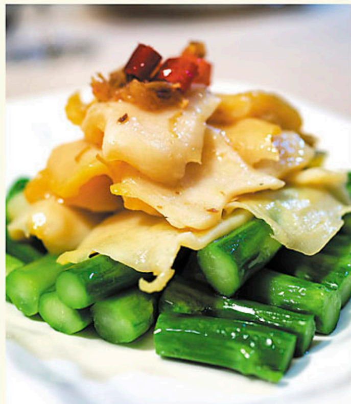
XO醬翡翠炒響螺片 $218 Sautéed Sliced Sea Whelk with Vegetables in X.O. Sauce 米国貝肉と野菜のXOジャン炒め