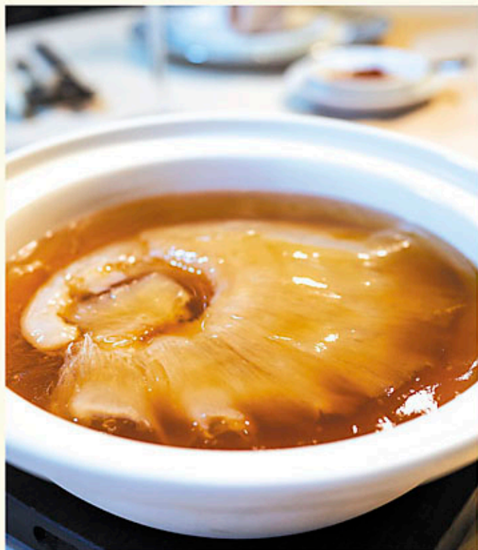
砂窩雞煲翅 4位用 For 4 Persons $888 Double-Boiled Shark's Fin Soup with Chicken in Casserole フカヒレと鶏のスープ(鍋盛)