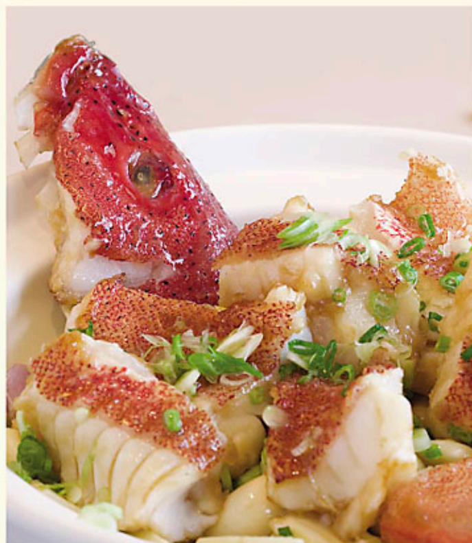
砂窩乾迫海斑 Seasonal Price 時價 Baked Fresh Grouper with Ginger & Tender Garlic in Casserole ハタの土鍋焼き