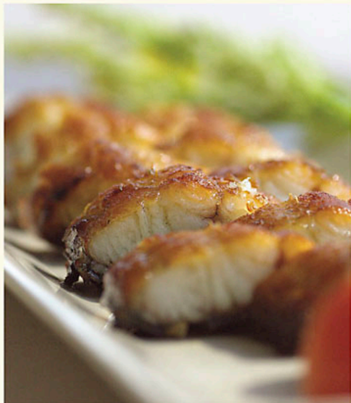
香燒脆鱈 $168 Barbecued Eel with Honey 生鰻の蜂蜜焼き