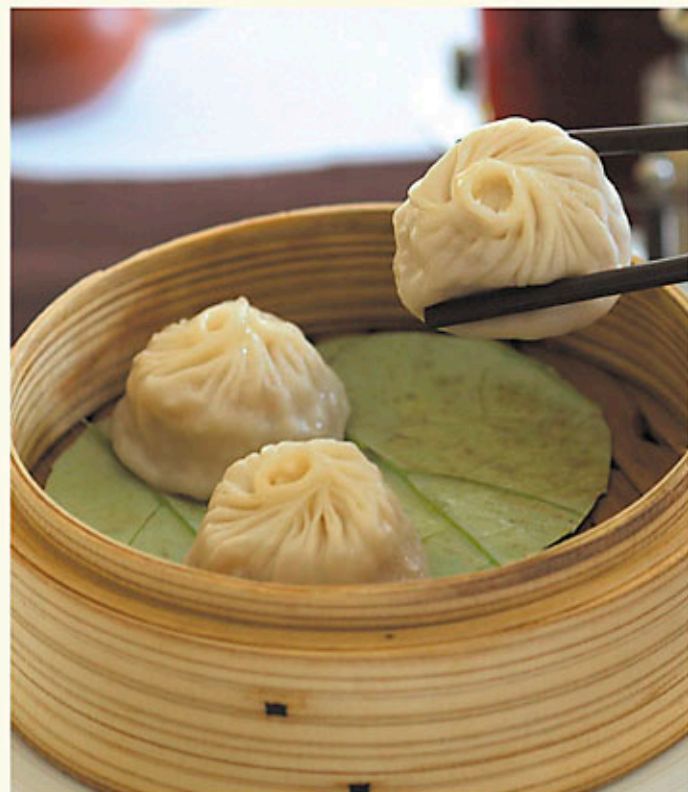
滬江小籠包(四件) $48 Steamed Minced Pork Bun (4 Pieces) ショウロンポウ(4個)