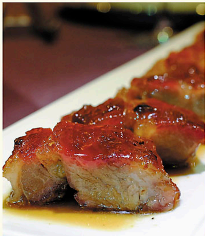
西班牙依比利黑毛豬叉燒 例 Portion $268 (純天然放養) Spanish Iberico Barbecued Pork イベリコ豚肉のチャーシュー