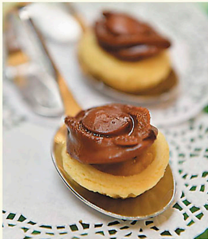
原隻鮑魚酥 每隻 Each $68 Baked Whole Abalone with Diced Chicken and Mushrooms Pastries アワビパイ