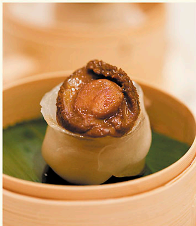
王子鮑魚餃 $68 Steamed Crystal Prawn Dumpling with a Abalone 鮑餃子