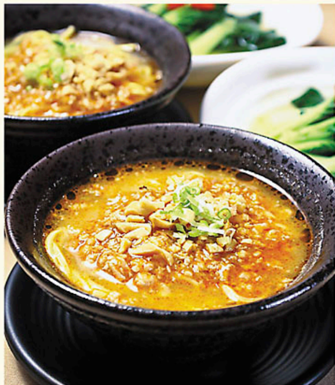
王子擔擔麵 每位 Per Person $58 Prince's Noodles with Minced Pork & Chili Oil タンタン麵