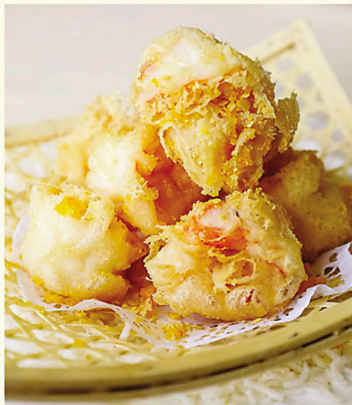
燕麥金沙蝦球 $168 Deep-Fried Prawns with Salty Egg & Oatmeal オート麦と卵黄つきの海老フライ