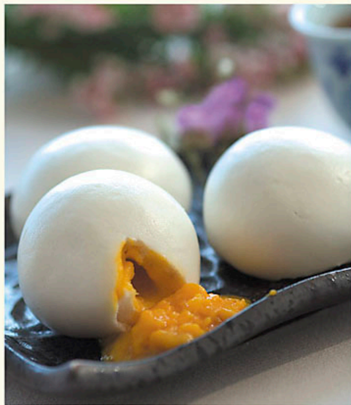
黃金流沙包(三件) $36 Steamed Egg Yolk Bun (3 Pieces) カスタード入り蒸し饅頭 (3個)