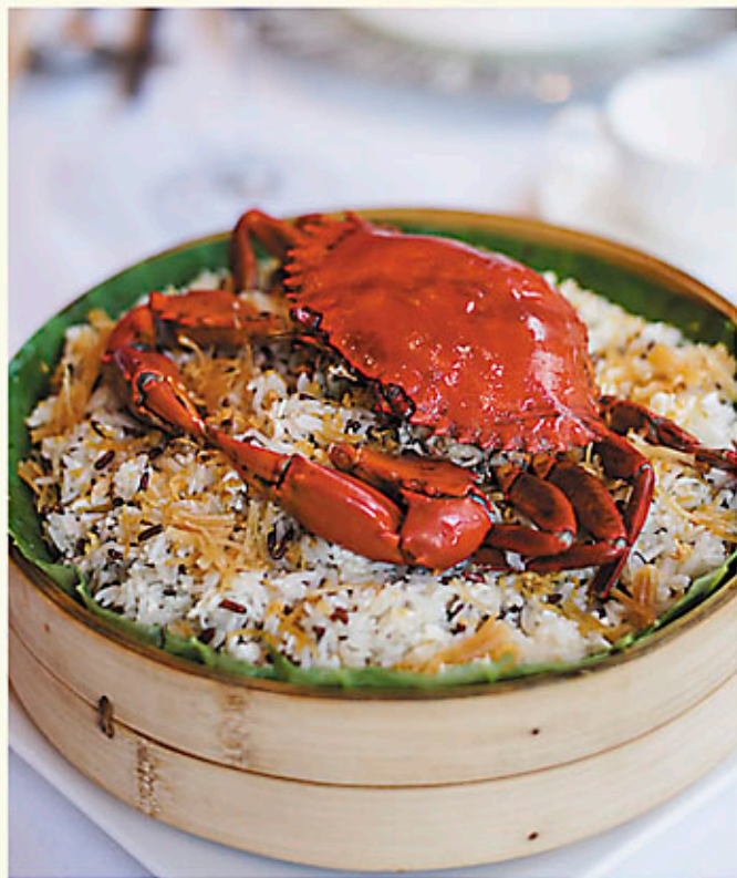
荷葉籠仔蒸蟹飯 時價 Seasonal Price Steamed Crab with Fried Rice Wrapped in Lotus Leaf 蟹とニンニクチャーハンの蓮の葉蒸し