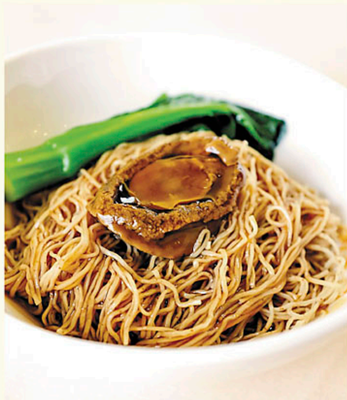
50頭吉品鮑魚撈蝦籽麵 每位 Per Person $148 Braised Noodles with 50 Head Yoshihama Abalone 50頭アワビかけのエビ子入り麵